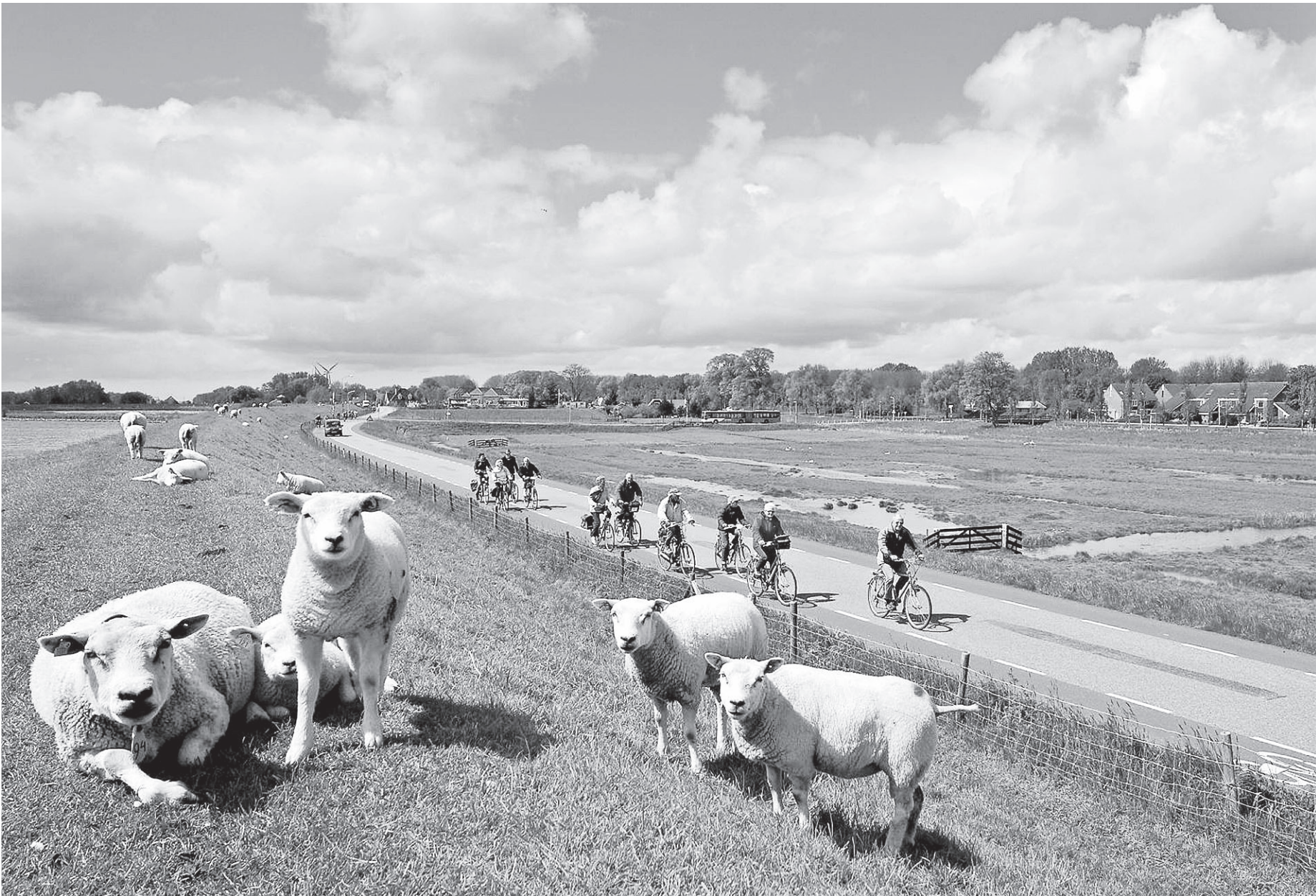
Schapen op de IJsselmeerdijk bij Hoorn. Het Hoogheemraadschap wil niet meer dan tien schapen per hectare dijk, vanwege beter beheer.

Het geld weegt voor de twee partijen zwaarder dan de natuur. Ook hebben zij andere bezwaren tegen fleurige, weelderige en kruidenrijke begroeiing langs polderwegen. Zij wijzen op overwaaiende onkruidzaden naar aangrenzend boerenland en op gevaar voor de verkeersveiligheid. Het algemeen bestuur van Hollands Noorderkwartier neemt vanavond een besluit over ander beheer. VVD en Boeren Burgers Waterbelang komen met een amendement. Het gaat om 900 kilometer wegberm, verspreid over heel Noord-Holland boven het Noordzeekanaal. Nu wordt 45 kilometer (5 procent) ecologisch beheerd. Dat betekent twee keer per jaar maaien en het maaisel afvoeren. Door deze methode kunnen kruiden spontaan groeien en kan fauna overleven. De overige 95 procent van de bermen (855 kilometer) wordt geklepel. Dit flijngeslagen gras blijft liggen. Het voedingsrijke tapijt levert overvloedig mineralen. Zeldzame, langzaam groeiende planten en andere vegetatie worden verdrongen door snelgroeiende, eenvormige soorten.